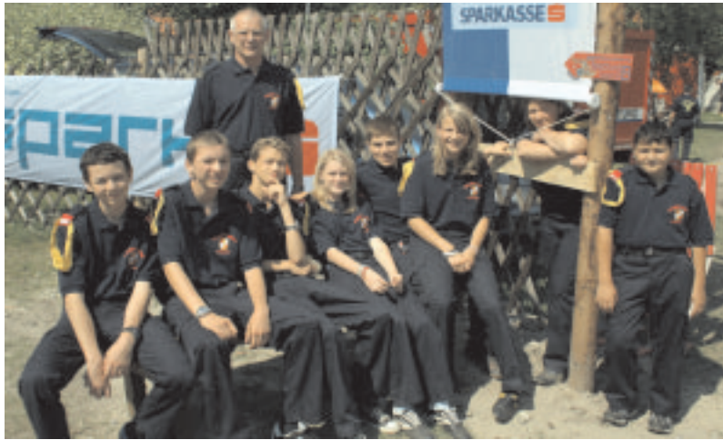
die erste Torwache 2006: FF Dörfles

FUSSBALL WM FINALE Samstag 21Uhr Live im Essenzelt!