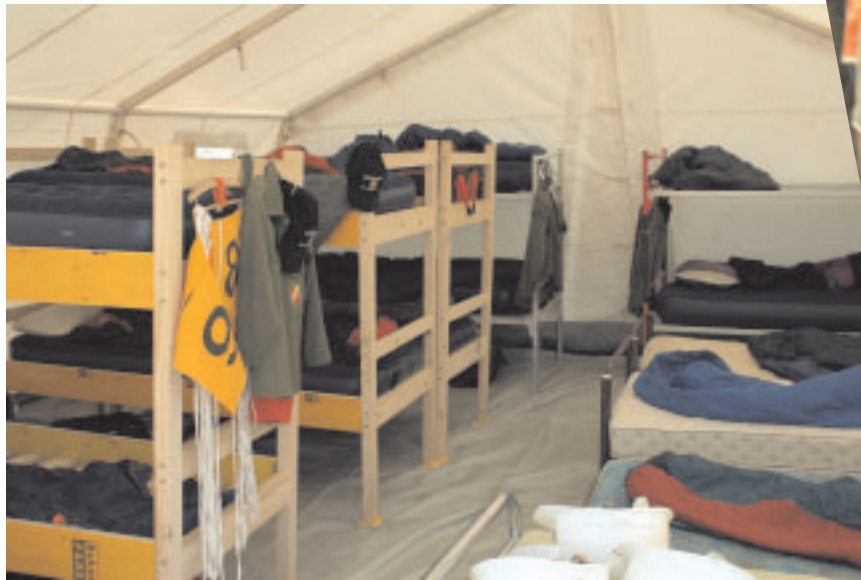
innovativ: Stockbetten als Antwort auf das Platzproblem im 360iger Zelt