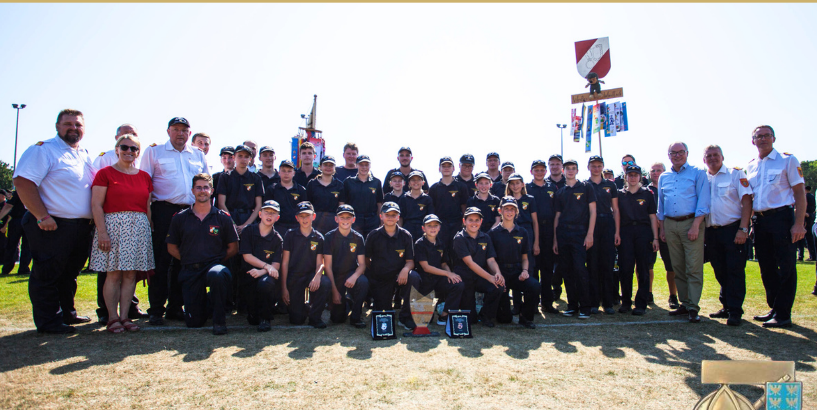
49. Bewerb um das FJLA in Bronze 3. Hollenthon / 1047,94 Punkte