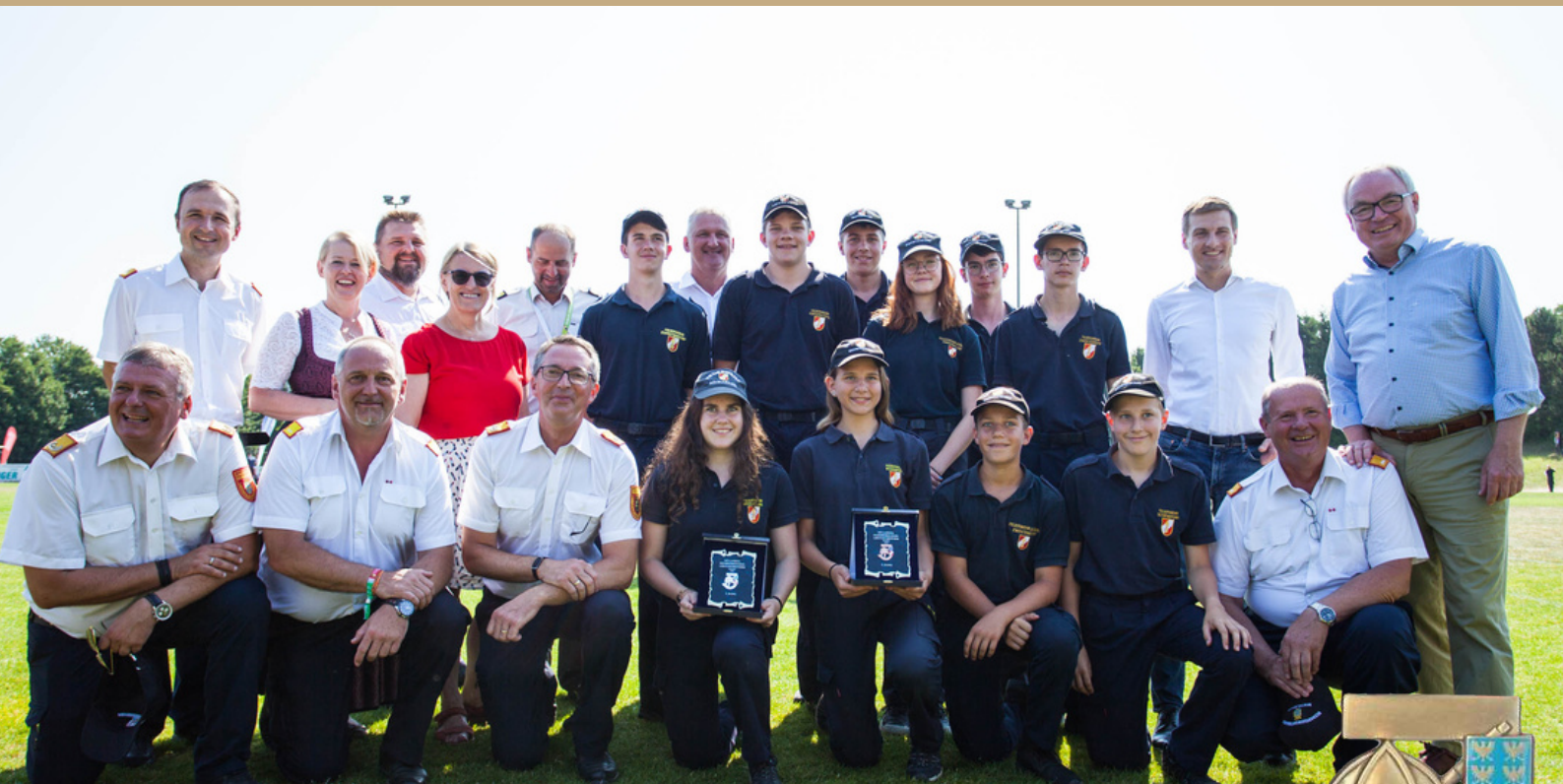
49. Bewerb um das FJLA in Bronze 2. Zwentendorf-Pyhra / 1048,03 Punkte