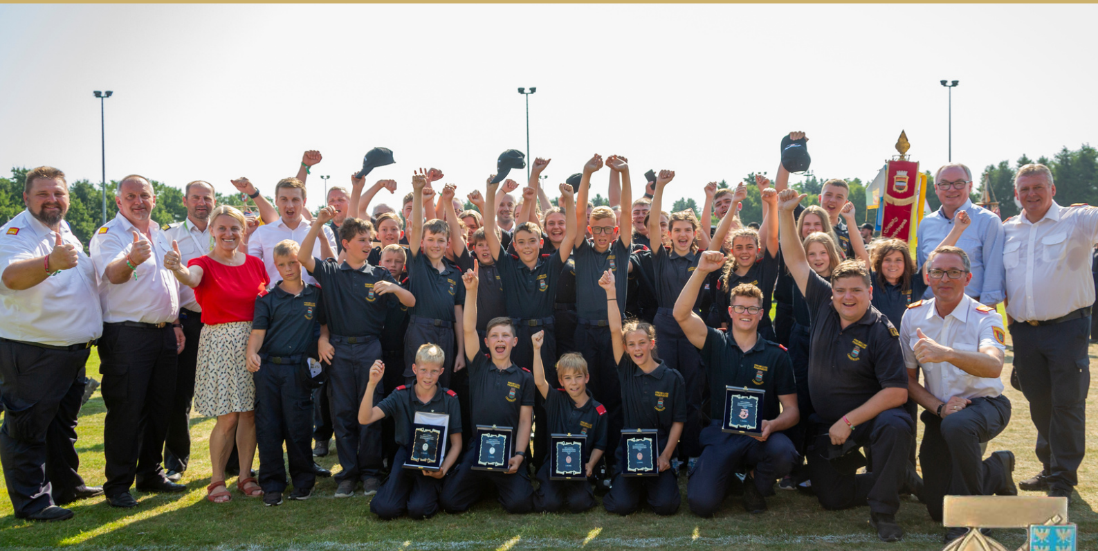
49. Bewerb um das FJLA in Bronze 1. Langenlois 1 / 1051,46 Punkte