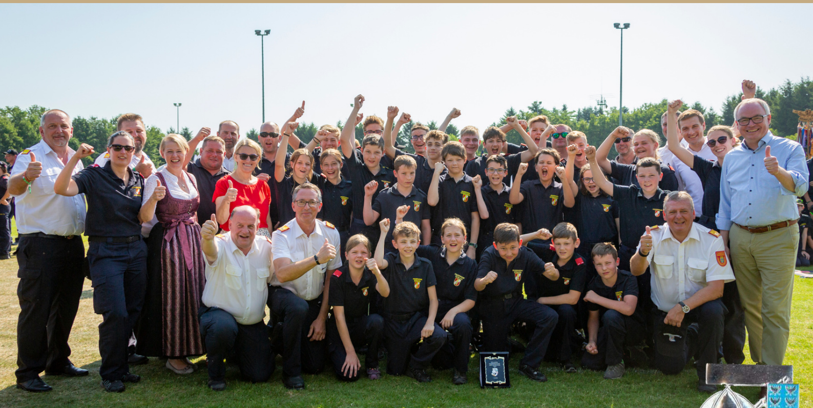
46. Bewerb um das FJLA in Silber 1. Zöbern-Königsberg-Schlag / 1048,99 Punkte